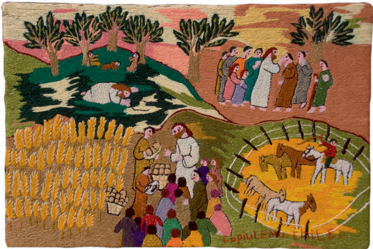
Illustration: Deutsches Komitee e.V.

Die Altkatholische Gemeinde in Kirchrode, Brabeckstr.24 lädt uns in diesem Jahr ein, gemeinsam den Weltgebetstag zu feiern.